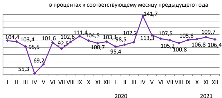
Индекс физического объема розничной торговли

Наибольший удельный вес в общем объеме розничной торговли республики в январе-декабре 2021 года приходится на г. Алматы (31,5%), г. Нур-Султан (11,3%), Восточно-Казахстанскую и Карагандинскую (8,8%) области.